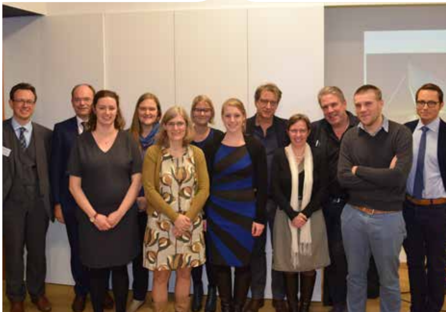
Professoren en medewerkers uit UGent, KU Leuven, UZ Brussel, Erasmus Universiteit Rotterdam en Dominiek Savio

"Ik communiceer veel meer sinds ik GRID gebruik. Ik kan via het programma makkelijk op Facebook en mijn TV bedienen. Zo kan ik nog beter supporteren voor mijn favoriete voetbalploeg Club Brugge!"